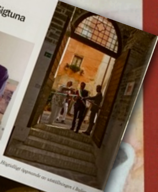
Högrydligt öppnande av utställningen i Italien